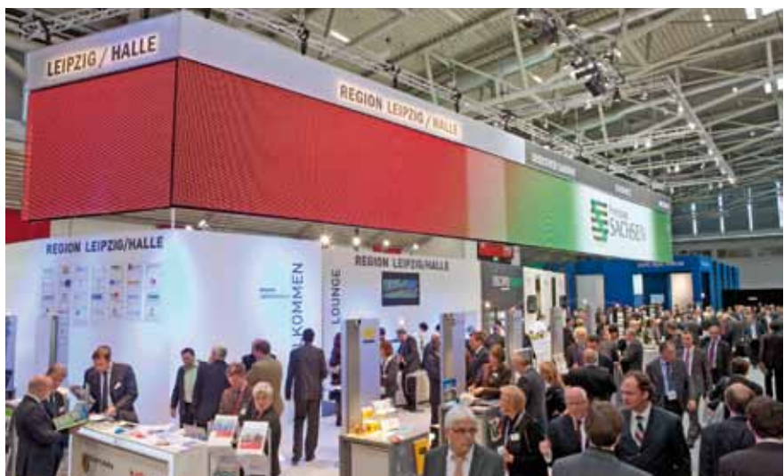
Auch in diesem Jahr wird sich die Region Leipzig / Halle und somit auch das GVZ Leipzig auf der Expo Real präsentieren.

Frank Schütze, TFG Transfracht, Fotolia, LBBW GVZ, Messe München, DHL, Porsche, Deutsche Bahn, Hoyer Unternehmensgruppe, Großmarkt Leipzig